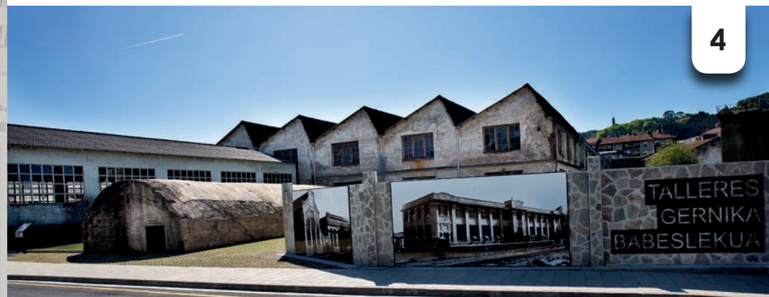
Refuge anti-aérien Talleres de Gernika

+ INFO MUSÉE DE LA PAIX DE GERNIKA Visites guidées Memori Tour Réservations www.museodelapaz.org