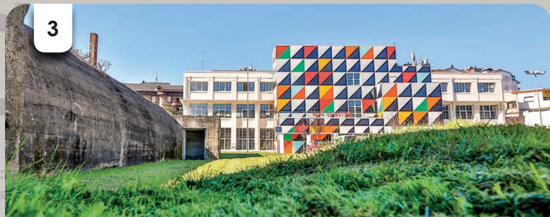
Refuge anti-aérien de la Fabrique d'armes Astra

L'usine de Talleres de Gernika (TdG) construisit deux abris en septembre 1936 pour abriter ses ouvriers :