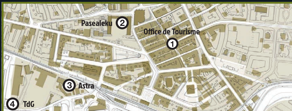
■ Bâtiments à Gernika avant le 26 Avril 1937