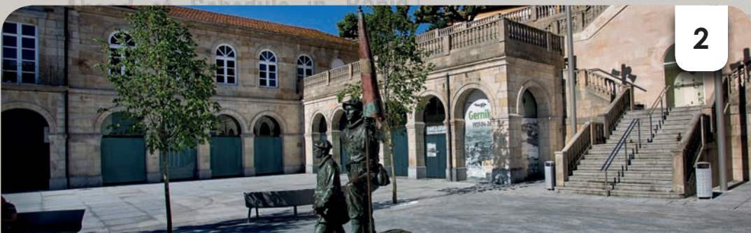
Ancienne entrée au refuge anti-aérien du Pasealekua